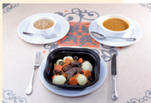
Esempio di pasto per persone allergiche

La foto è unicamente a titolo indicativo